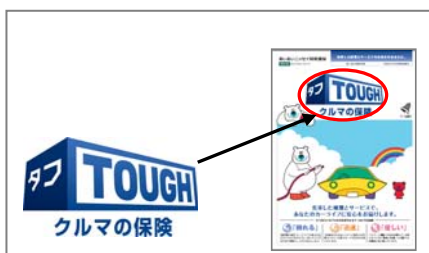
①パンフレットのロゴを撮影