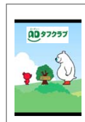
③ ADタフクラブのムービーが再生