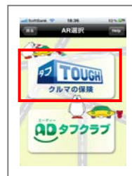
②画面のロゴをタップ