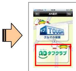
② 画面のロゴをタップ