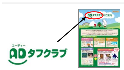
① チラシのロゴを撮影