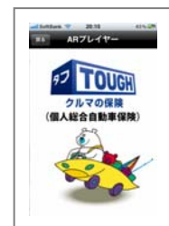
③「タフ・クルマの保険」のムービーが再生